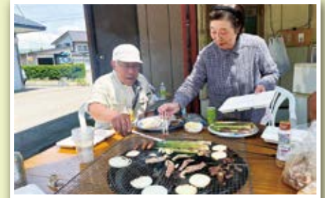
養蜂家さんと楽しくバーベキュー！