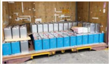
全部りんごはちみつです

りんごの花が1週間以上早く咲きそうなので慌てて移動した養蜂家も多かったのですが…。結局寒波が戻ったり、雪が降ったりで例年通りの時期に花が咲きました。でも雨も多く、気温も上がりずりんごの蜂蜜も7割程度の採れ高になってしまいました。