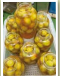
たくさん漬けました！