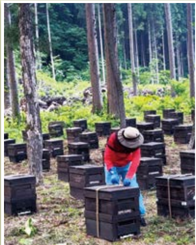
朝4時半から作業開始