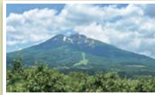
りんご畑と岩木山