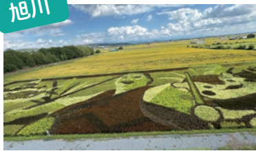
金メダリスト北口榛花さん

22年間色々な養蜂家と共に過ごしてきた私に嬉しいサプライズで還暦のお祝いをしていただきました。不作の年でヒマで良かったです。そのまま名寄に出来なかった養蜂家が中標津でお祝いをしていただきました。