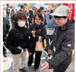
静岡マラソンフェスタ

これは、走る人だけではなく。 部活を頑張る子どもも、日々忙しく働く大人も、 体を動かすすべての人に共通しています。